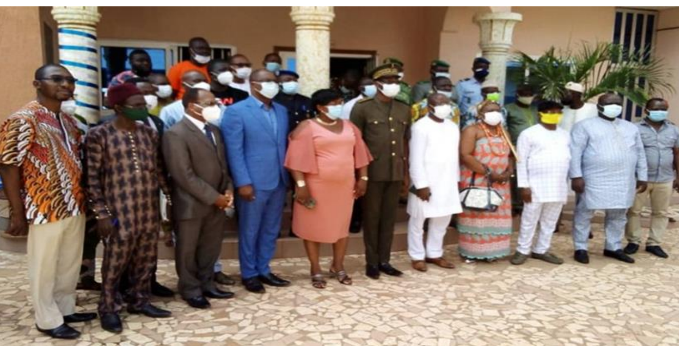
Membres Comité de Bassin du Mono au Bénin et au Togo